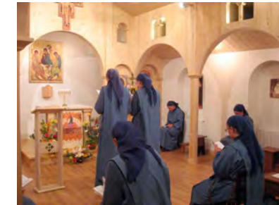
Oración litúrgica Lugar de oración abierto a todos los vecinos del barrio.