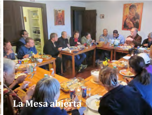
La Mesa abierta