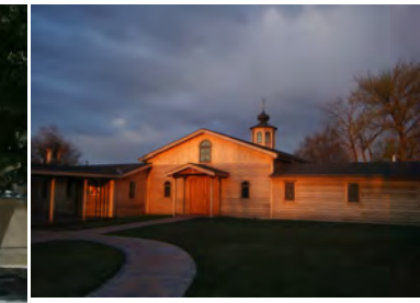
Kansas City (Estados Unidos)

Salimos a llevar a todos la proximidad del Amor de Dios y la alegría de vivir.