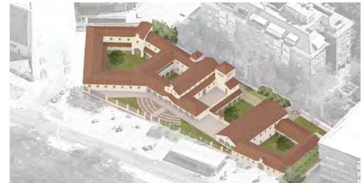
Proyecto en Madrid, Avenida de Córdoba, 17-19